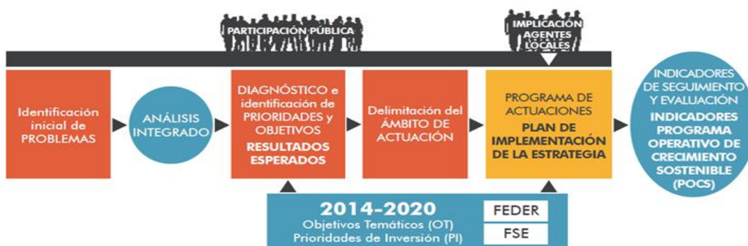
Ilustración 1.- Metodología de Diseño de la Estrategia DUSI

Se entiende como punto de partida el análisis del proceso participativo realizado para el diseño y puesta en marcha de la EDUSI al objeto de determinar los agentes clave para lograr una participación efectiva y el adecuado feedback por parte de éstos.